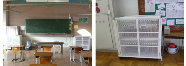
(左)学習室の黒板の両サイドに1台ずつ(右)1年教室横廊下に充電保管庫が設置されました。

本校でもこの教育を推進していくため、高速ネットワーク化の工事と、一人一人に整備するPC端末の充電保管庫の設置工事がこのほど行われました。充電庫は1、2年生は教室横の廊下に、3年生以上は自教室横の学習室等に設置されました。毎日帰る前にその保管庫で自分のPC端末を充電するようになります。各自の端末は本年度中に入る予定になっています。